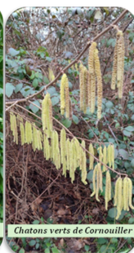
Chatons verts de Cornouiller