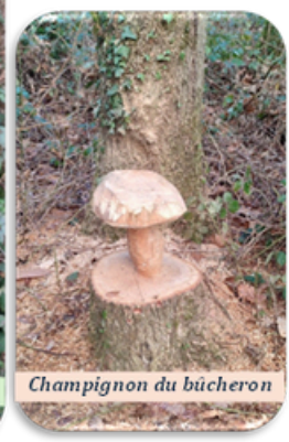
Champignon du bûcheron